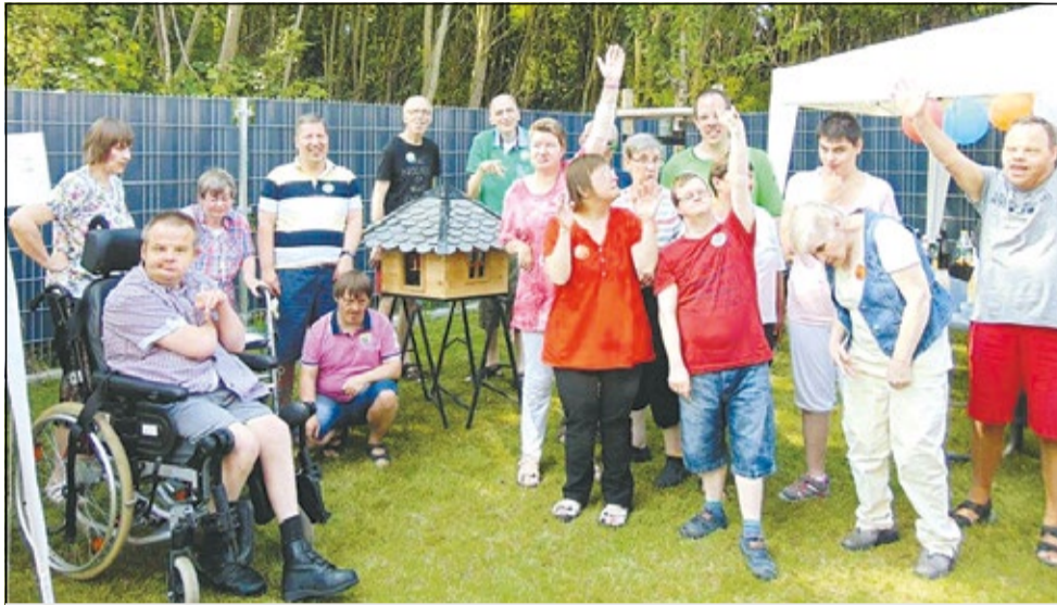
Das Sommerfest der Wohnstätte war ein voller Erfolg.

Um den Einzug in das neue Haus zu feiern, fand im Garten des Hauses ein schönes Sommerfest statt, welches dank langer und sorgfältiger Vorbereitung zum vollen Erfolg wurde. Die Zeit verging wie