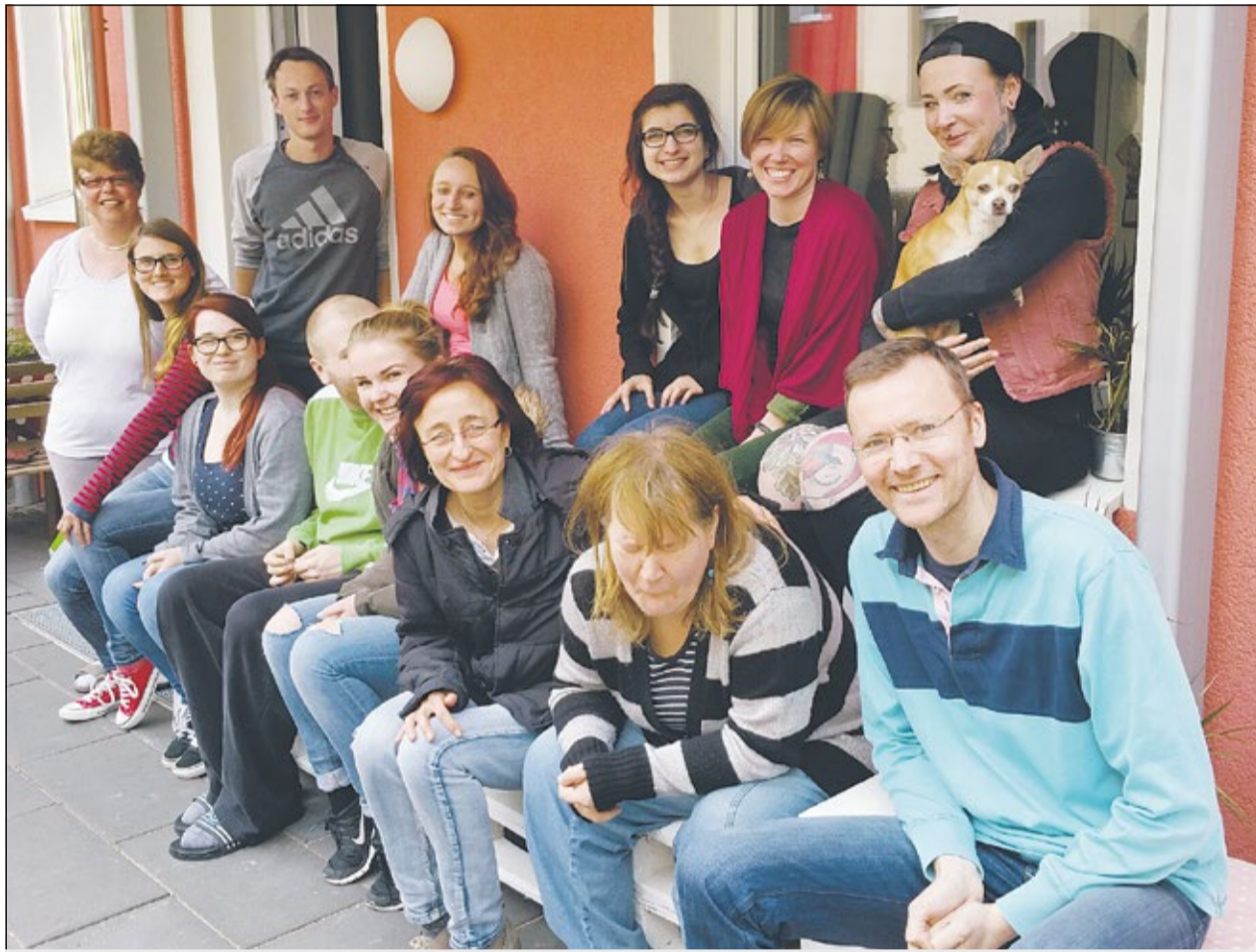
Gemeinsam aktiv: Bewohner und Mitarbeiter der inklusiven Hausgemeinschaft in Dortmund.

Inklusive Hausgemeinschaft: Studenten und Menschen mit Behinderung wohnen gemeinsam und erfahren viel über ihr Leben