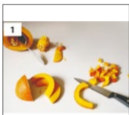
Kürbis halbieren, Kerne und Fäden entfernen, in Stücke schneiden.

Aus: Kochwerkstatt des Familienunterstützenden Dienstes der Lebenshilfe Heinsberg in leichter Sprache (Seite 4)