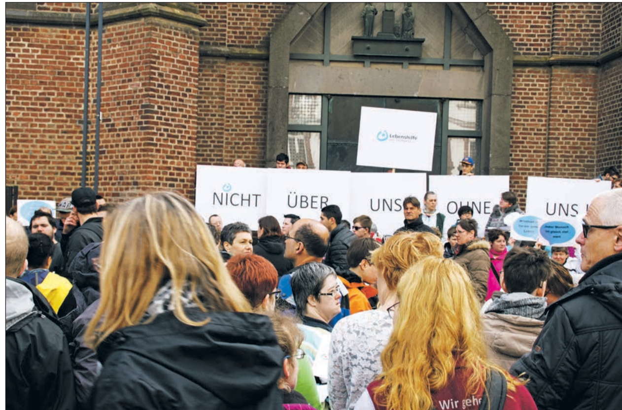
Demo der Lebenshilfe Rhein-Kreis Neuss auf dem Grevembroicher Marktplatz

Demo der Lebenshilfe Rhein-Kreis Neuss e.V. und anderer Lebenshilfen