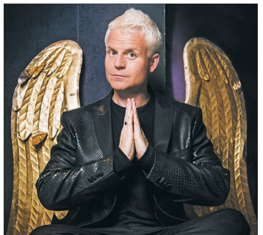
Guido Cantz sanft wie ein Engel: Neue Comedytour „Blondiläum – 25 Jahre Best of Guido Cantz“ startet ab 30. September.