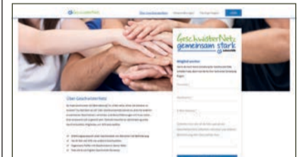
So sieht die Startseite des GeschwisterNetzes aus.

S ie sind unter besonderen Bedingungen groß geworden und fühlen sich als Erwachsene oft für ihren Bruder oder ihre Schwester verantwortlich: erwachsene Geschwister von Menschen mit Behinderung. GeschwisterNetz ist ein neues Online-Angebot der Bundesvereinigung Lebenshilfe. Es soll erwachsene Geschwister von Menschen mit Behinderung verbinden, unterstützen und stärken.